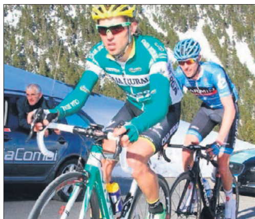
El talaverano es la gran esperanza para el equipo de Caja Rural.

ta por delante, Arroyo quiere reafirmar su buen momento y luchar con los de arriba, empresa para la que contará con el apoyo de sus compañeros, entregados al líder del equipo talaverano como se ha visto hasta el momento.