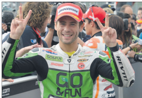
Así de contento se mostró el talaverano tras conseguir el 2º puesto en la Q2. GRESINI