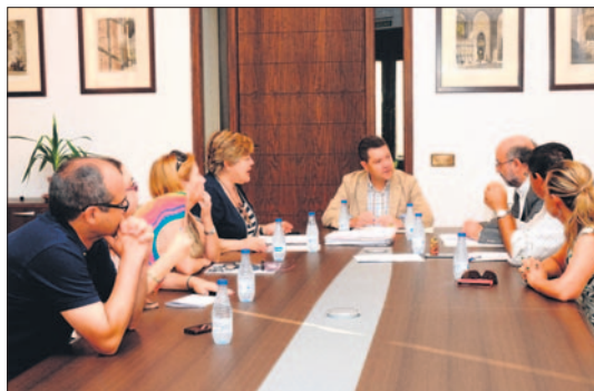
El Gobierno municipal toledano mantiene sus dudas respecto al nuevo Hospital.

el nuevo hospital “no sea un experimento de negocio para algunos” y tenga más servicios que los que se prestan actualmente en Toledo, garantizando la atención sanitaria para los toledanos como hasta ahora lo ha estado haciendo el Virgen de la Salud.