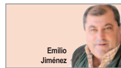
LOS CUERNOS DE LA LUNA

presidenta como el PP, por los diferentes "escándalos políticos que los afectan". Y sin dejar escapar la oportunidad para aclarar la 'subida de impuestos' aconsejada por el PSOE, asegurando que se refiere a las rentas 'muy altas' de la región, que sólo suponen el 20% de las familias castellano manchegas.