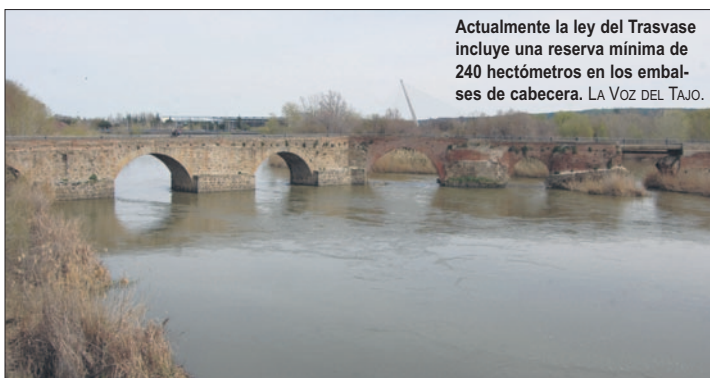
Actualmente la ley del Trasvase incluye una reserva mínima de 240 hectómetros en los embalses de cabecera. LA VOZ DEL TAJO.

Según información aparecida en el ABC, esta normativa se convertiría en un arma de doble filo para los intereses de la cuenca.