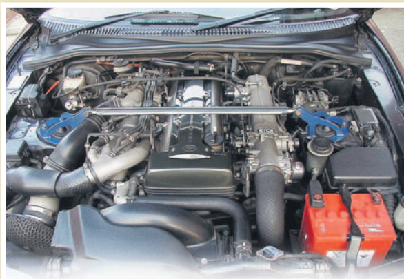
La revisión del vehículo tras las vacaciones es muy importante para su correcto funcionamiento durante el resto del año, por lo que es recomendable acudir a nuestro taller de confianza para chequear su estado.

Con el motor frío, comprueba el nivel del líquido del sistema de refrigeración observando el vaso de recuperación. El nivel ha de estar entre el mínimo y el máximo que esta indicado en el vaso y nunca debe llenarse del todo.