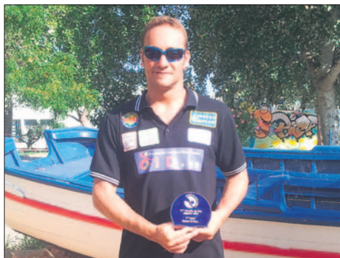
El nadador talaverano con el trofeo conquistado.