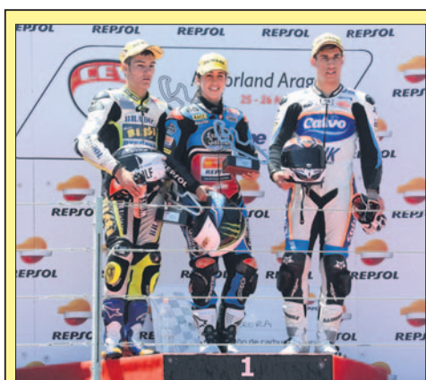
La piloto de Oropesa en su último podio.