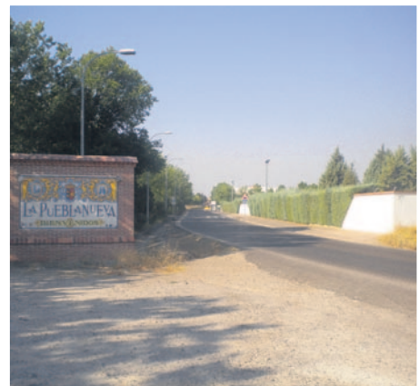
El equipo de gobierno ha realizado un amplio trabajo de pavimentación en distintas calles de la población. LA VOZ DEL TAJO.

11:00.- Juegos populares, en la plaza, para niños y mayores 14:00.- Degustación de paella. Se cobrará un euro para la reparación de la torre 18:00.- Concurso de repostería 20:00.- Subasta de regalos para el Cristo de Nazareno. Tras la subasta, guiso de vaquilla para todos 22:00.- Verbena popular amenizada por la orquesta Victoria