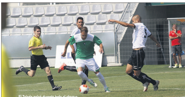
El Toledo peleó durante todo el choque pero se vino de vacío de La Fuensanta.