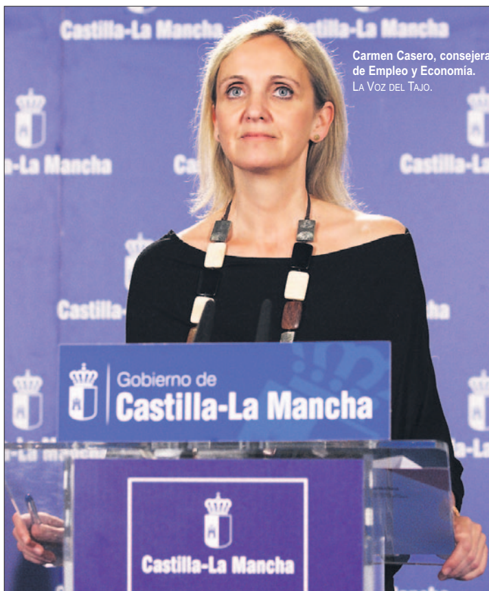
Carmen Casero, consejera de Empleo y Economía. LA VOZ DEL TAJO.

Las exportaciones en la región durante el mes de junio de 2013 alcanzaron la cifra acumulada de 2.253,2 millones de euros, un 13,4% más respecto al mismo periodo del año anterior.