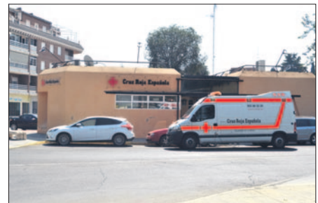
La ONG atiende a una gran mayoría de ciudadanos en riesgo de exclusión. LVDT.

de los beneficiarios de las ayudas son españoles y el tramo de edad que más demanda sus servicios, en torno a un 75%, son personas de menos de 50 años. Finalmente, el presidente hizo un llamamiento a la solidaridad ciudadana para colaborar en una nueva campaña denominada 'Ahora + que nunca', con el objetivo de sumar colaboraciones con el creciente número de familias con alto nivel de pobreza.