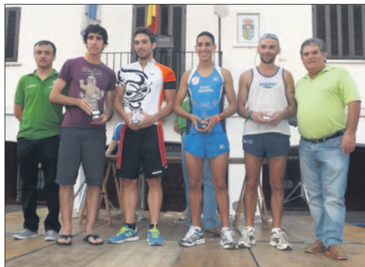
Diversos momentos del comienzo del programa cultural con la celebración de la carrera popular 'Villa de Saucedo' que disfrutó de una alta participación entre los vecinos de Talavera la Nueva. LVDT.