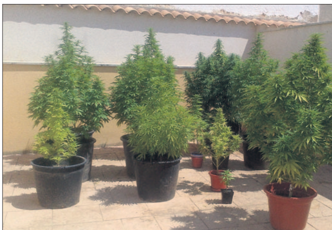
Imagen remitida por la Guardia Civil de las plantas incautadas en la localidad de Turleque.

Los bomberos determinaron que la causa de la explosión fue una acumulación de gases y que las instalaciones de la gasolinera, tal y como informó Efe, no están en peligro.