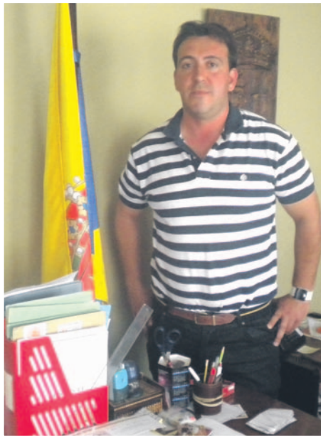
Pedro Gómez de la Hera será el alcalde de Pueblanueva en estos dos últimos años de la legislatura. LA VOZ DEL TAJO.

PEDRO GÓMEZ DE LA HERA, ALCALDE DE PUEBLANUEVA