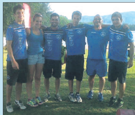
La expedición talaverana desplazada a Bañolas.