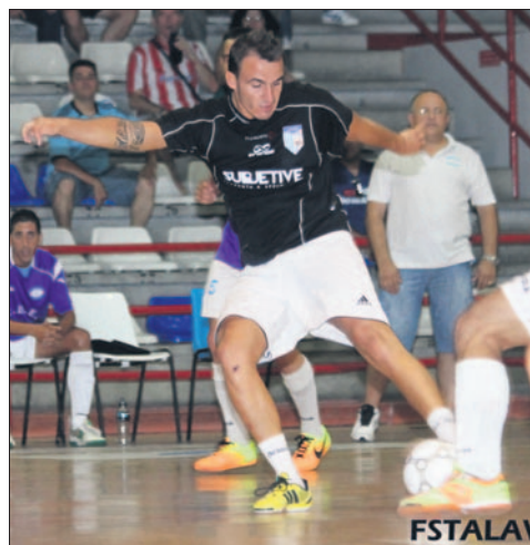
Buena imagen en el primer partido de la historia del club. FS TALAVERA.