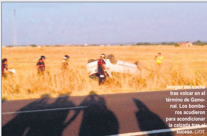
Imagen del coche tras volcar en el término de Gamonal. Los bomberos acudieron para acondicionar la calzada tras el suceso. LVDT.

Un turismo se salió de la calzada en la carretera de Alberche, que comunica las localidades de Gamonal y Alberche y que se encuentra junto a la A-5, dando varias vueltas de campana hasta terminar en una de las parcelas aledañas en término municipal de Gamonal. Pese a lo espectacular del accidente, según cuentan los testigos, el conductor salió por su propio pie, aunque con varias heridas de diferente consideración. Hasta el lugar se desplazaron los Bomberos de Talavera, la Policía Nacional y una ambulancia. El suceso tuvo lugar pasadas las 19.30 horas del domingo.