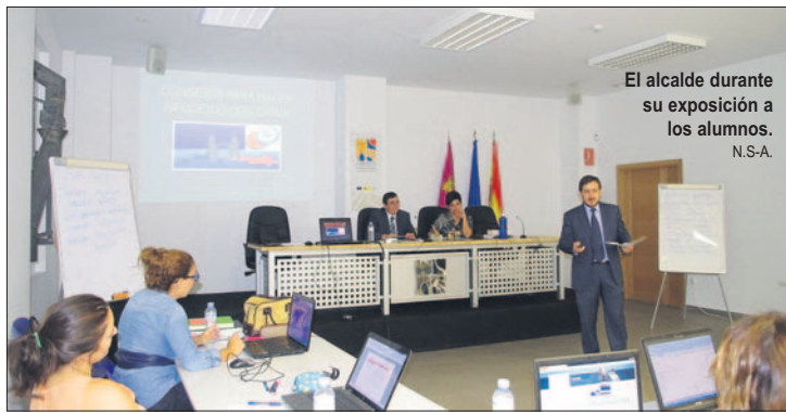
El alcalde durante su exposición a los alumnos. N.S-A.

Algunos consejos para hacer negocios en China. - "A la hora de emprender negocios con los chinos sobre todo hay que armarse de paciencia, principalmente en las primeras etapas, y tratarles muy de tú a tú, muy por igual" . Es uno de los consejos que trasladó el Alcalde de Torrijos, explicando que para tratar con ellos hay que ser sencillos tanto en el comportamiento como en la vestimenta, sin ser prepotentes, tampoco ostentosos ni demostrar "miopía cultural" haciendo gestos de desprecio hacia lo diferente. Según apuntó Gómez-Hidalgo, es necesario adaptarse a su ritmo lento para formalizar un acuerdo, "si te marcas un calendario te frustras y ellos pueden tomar ventaja de tu impaciencia, así que cuidado" . Es un error hablarles de fechas límites. Además, se ha de tener en cuenta que para los chinos los comentarios directos son ofensivos. Su lógica mental no está orientada a los extremos "de mal