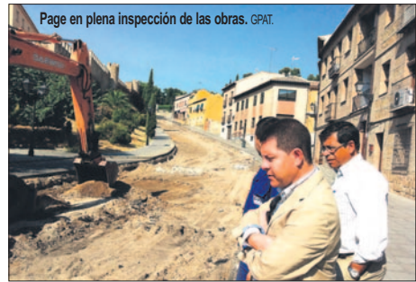
Page en plena inspección de las obras. GPAT.