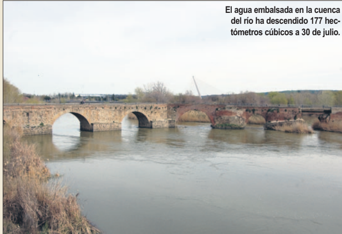
El agua embalsada en la cuenca del río ha descendido 177 hectómetros cúbicos a 30 de julio.

Asimismo, la Asociación precisó que "no hace falta un sesudo estudio hídrico para concluir que la cuenca del Segura puede mantener sus niveles de embalsamiento y reservar gracias a la esquilmación que se está haciendo en la cuenca del Tajo, con la agresión en cabecera del trasvase Tajo-Segura".