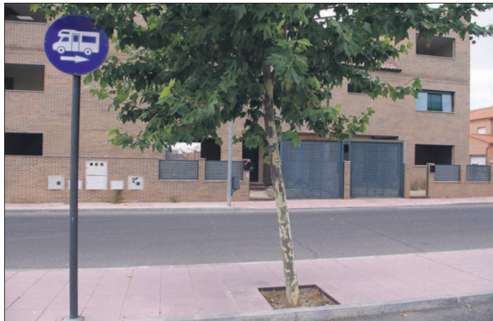
De esta forma, Torrijos se integra en la Red de Aparcamientos provincial.