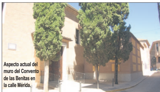
Aspecto actual del muro del Convento de las Benitas en la calle Mérida.