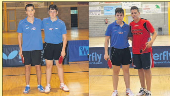
Imágenes de algunos de los vencedores en la cita deportiva celebrada en Navalcán. LVDT.