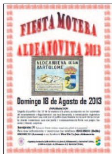
Carteles de las actividades a realizar en estos días en Aldeanueva.