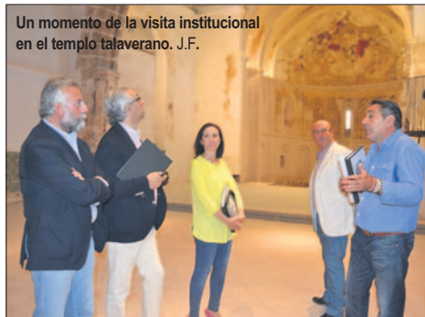
Un momento de la visita institucional en el templo talaverano. J.F.

Las pinturas murales datan del siglo XIII y muestran un Pantocrátor incluido en una Mandorla, con dos ángeles en cada lateral.