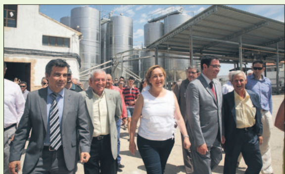
La consejera de Agricultura en su visita al Museo del Vino en El Herrumblar. LVDT.