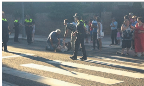
Instante justo posterior al atropello producido en la Avenida de Extremadura.

que le provocó heridas leves y contusiones en la cabeza, hombro y codo de la parte derecha de su cuerpo. Quince minutos después, "una exageración", según se quejaron algunos presentes, acudió una ambulancia para trasladar a la herida al Hospital Nuestra Señora del Prado de Talavera.