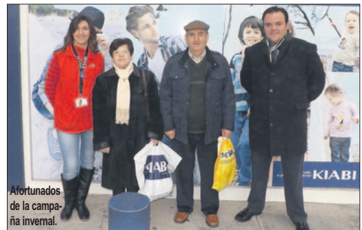
Afortunados de la campaña invernal.