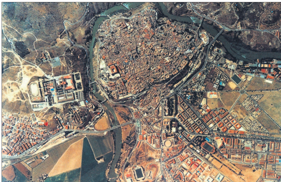
El Alcalde de Toledo ha solicitado a la presidenta de la Junta de Comunidades que urbanice terrenos para suelo industrial en el Polígono.