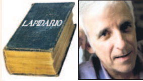
KIKO VENENO CANTANTE Y MUSICO DE FLAMENCO (PARA EL PAIS)

"La mafia española es más perfecta que la italiana: no necesita matar"