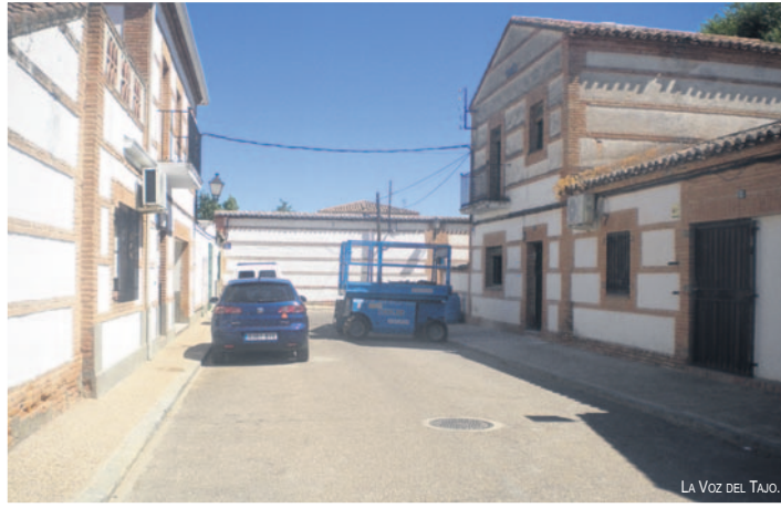
LA VOZ DEL TAJO.

La transformación de la plaza Emilia Fernández ha sido el mayor logro