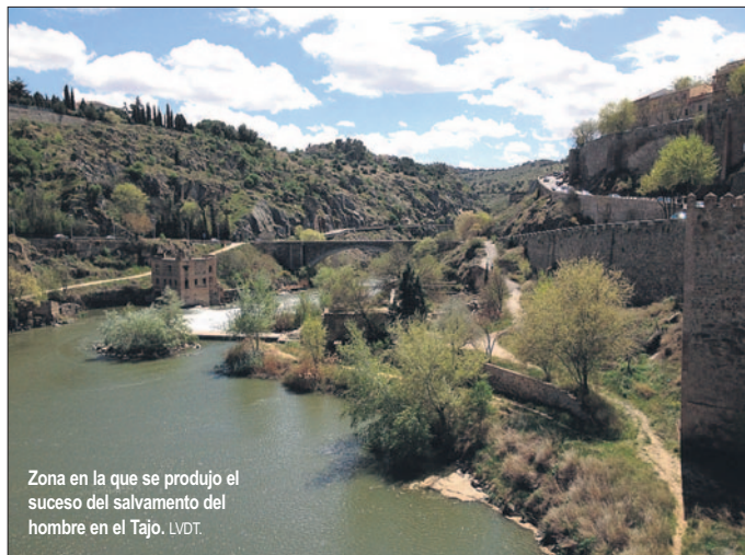
Zona en la que se produjo el suceso del salvamento del hombre en el Tajo. LVDT.

Más tarde, La Voz del Tajo pudo conocer que el individuo padece una enfermedad infecciosa, por lo que la dotación que trabajó en el rescate tuvo que acudir a la mutua correspondiente para realizarse unos análisis que descarten un posible contagio producido durante el acto de salvamento.