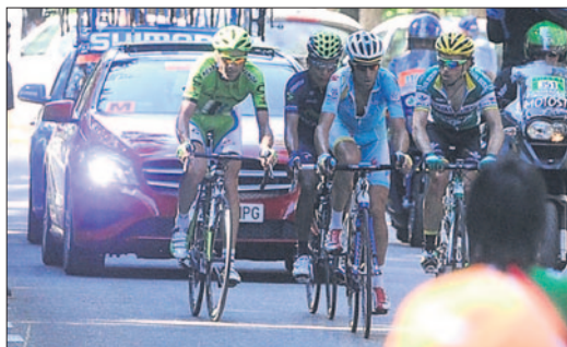
El talaverano (arriba) saluda en el podio tras lograr la segunda plaza tras una emocionante lucha en la última etapa de la ronda (abajo). www.vueltaburgos.com