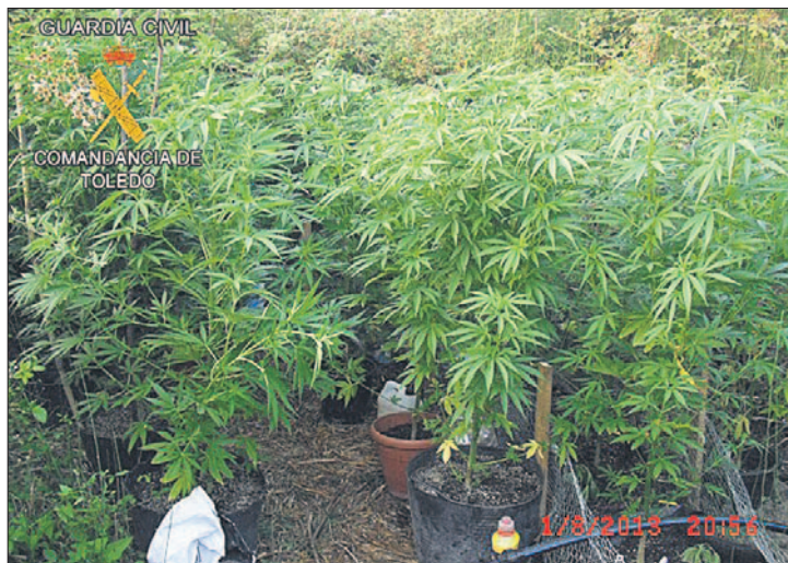
Imagen de la plantación de marihuana en Calera con 45 ejemplares incautados.