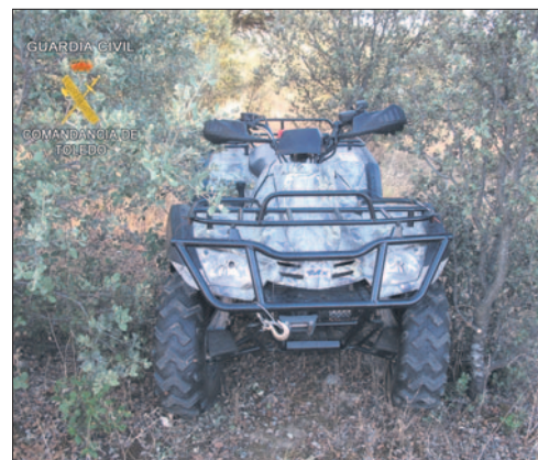
El quad robado fue recuperado por la Guardia Civil.

En el transcurso de esa misma mañana, la inspección ocular realizada por la Guardia Civil de Santa Olalla en varias viviendas de la urbanización permitió recuperar las dos cámaras sustraídas durante la noche anterior. Asimismo, en las inmediaciones localizaron un quad