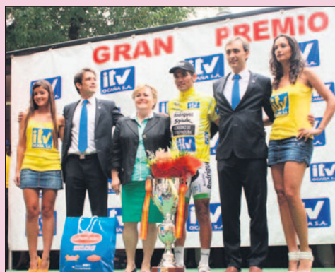
El ganador con las autoridades, tras conseguir la victoria en la Vuelta.

La 48 Vuelta Ciclista Internacional a Toledo '57 Trofeo Bahamontes Gran Premio ITV Ocaña', iniciada el pasado 3 de agosto, ha constado de cuatro etapas con la presencia de 13 equipos de categorías de élite y sub-23.