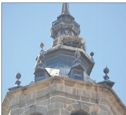
Los nidos de la Colegial podrían instalarse provisionalmente en el Tajo. R.G.

Es por tanto, por lo que el colectivo califica como craso error eliminar estos idos por lo que supone para Talavera y el atractivo turístico que las 'zancudas' dan a la ciudad. Las aves forman parte de esta comunidad local, por lo que desde Arrabal instan al Ayuntamiento y a La Colegial a buscar soluciones alternativas que no perjudiquen en este sentido a estas 'seculares vecinas'.