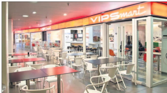
El nuevo restaurante en el Centro Comercial Los Alfares viene a sumarse a la atractiva oferta del complejo. La Voz del Tajo.

porcionará el cine en 3D y 4D de 'imponentes pantallas' y novedosas butacas, se suma la próxima apertura de la franquicia de VIPS además de la reciente apertura de otros nuevos establecimientos en el centro comercial que prometen, aparte de ofrecer nuevas alternativas a los talaveranos para disfrutar de su tiempo libre, impulsar el crecimiento económico y empresarial de la ciudad.