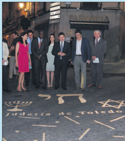
La nueva iluminación de la judería está siendo un éxito.

lizan dos veces a la semana, los lunes y los miércoles a las 22:00 horas, iniciándose en la plaza del Consistorio.