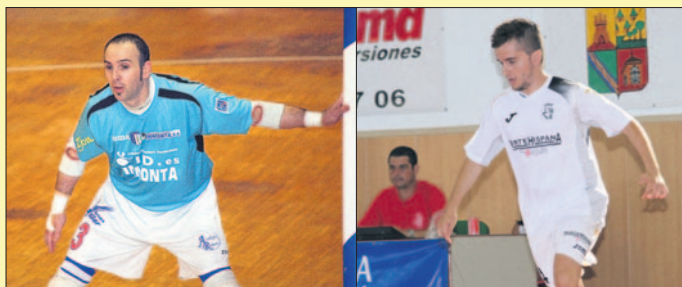
Imágenes de las tres incorporaciones que comenzaron a entrenarse con su nuevo club. FS.T.