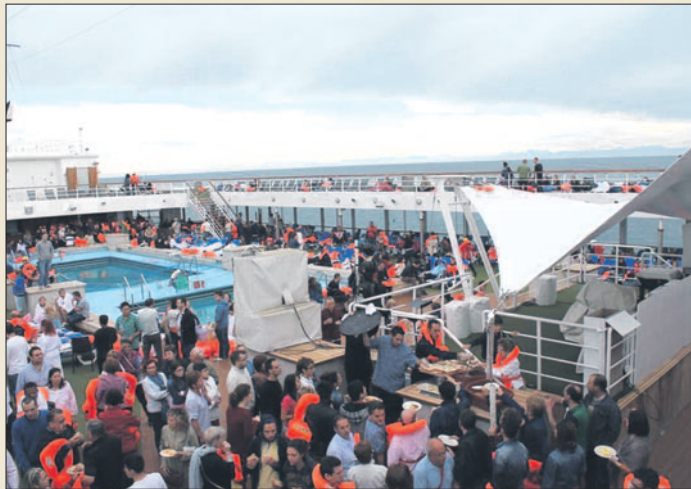
Los pasajeros con los chalecos salvavidas en la cubierta del crucero.