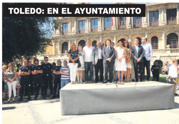
TOLEDO: EN EL AYUNTAMIENTO