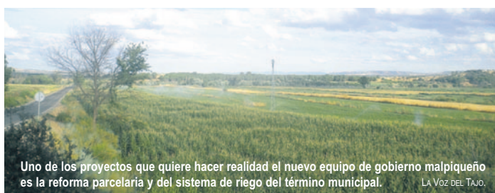
Uno de los proyectos que quiere hacer realidad el nuevo equipo de gobierno malpiqueño es la reforma parcelaria y del sistema de riego del término municipal.