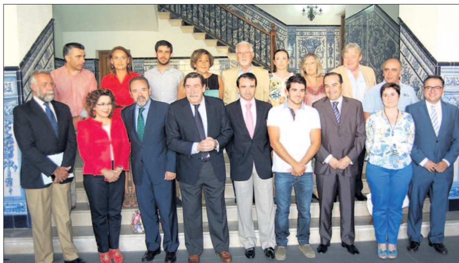
El delegado del Gobierno y las autoridades, junto a integrantes del Talak, visitaron las riberas del Tajo y donde se ubica el club de piragüismo. J.F.