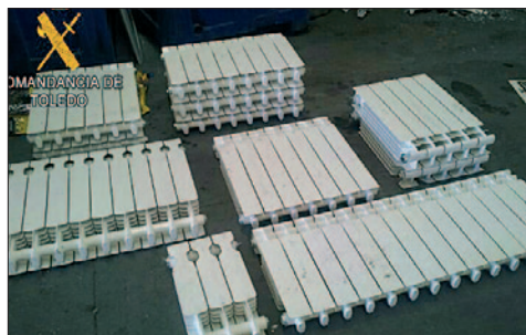
Los radiadores fueron recuperados y detenido el autor del robo.

La Guardia Civil ha detenido a M.F.D.S. de 29 años de edad, por un delito de robo con fuerza en las cosas cometido en una vivienda de la localidad de Chozas de Canales, recuperando todos los efectos sustraídos. El pasado día 27 de junio, un vecino de la localidad de Chozas de Canales denunció en el cuartel de la Guardia Civil de Valmojado haber sido víctima de un robo en una vivienda de su propiedad en el que su autor, tras saltar el vallado exterior y forzar una ventana, sustrajo 11 radiadores. El Grupo de Investigación de la Guardia Civil de Valmojado se hizo cargo de la investigación, en la que contó con el apoyo y la colaboración de la Policía Local de Chozas