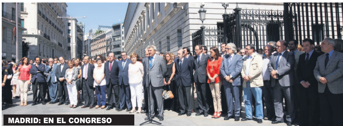
MADRID: EN EL CONGRESO