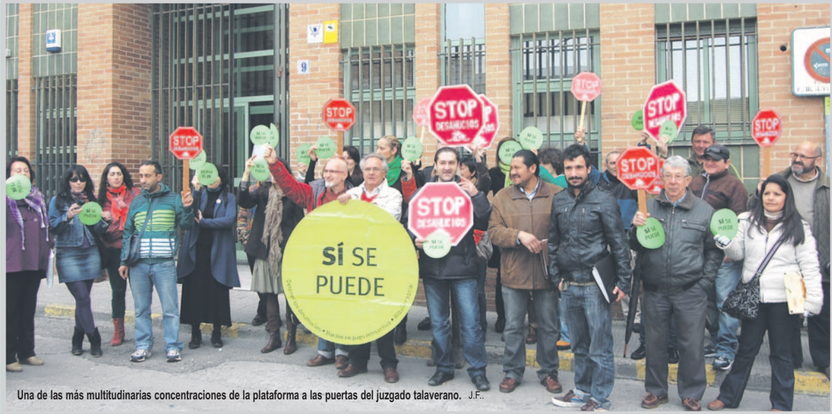
Una de las más multitudinarias concentraciones de la plataforma a las puertas del juzgado talaverano. J.F.

La labor social de la Plataforma de Afectados por la Hipoteca ha ayudado a más de cien familias en poco más de medio año de vida