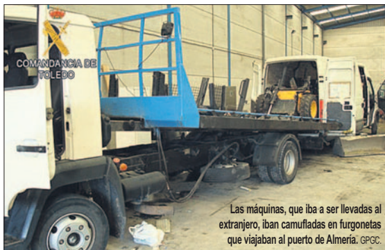
Las máquinas, que iba a ser llevadas al extranjero, iban camufladas en furgonetas que viajaban al puerto de Almería.

La Guardia Civil comprobó que los dos vehículos se dirigían a una calle donde esperaba el conductor de un camión góndola para cargarlas y transportarlas hasta el puerto de