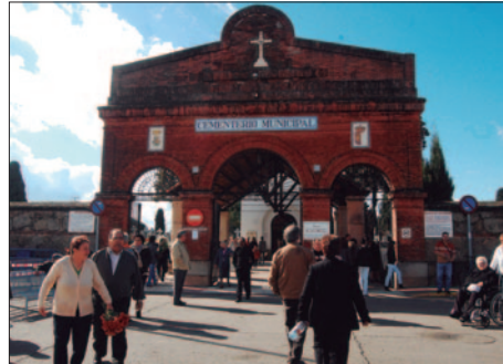
El actual cementerio verá readequados algunos de sus cuadros de párvulos.

Para llevar a cabo esta labor, Ramos precisó que se comprobarán aquellas sepulturas que tienen una concesión en vigor y constatar cuáles son las que están "abandonadas"; todo ello "con el mayor respeto a las familias", según expuso. El Ayuntamiento va a notificar a todas las personas que tienen alguna concesión en vigor de las sepulturas y se abrirá un periodo de exposición pública con la publicación en el Boletín Oficial de la Provincia (BOP) de este anuncio. El