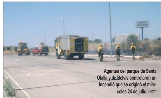
Agentes del parque de Santa Olalla y de Belvis controlaron un incendio que se originó el miércoles 24 de julio. LVDT.