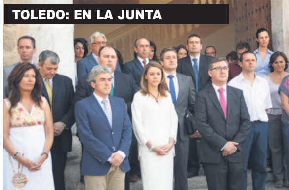
TOLEDO: EN LA JUNTA

timas lanzando mensajes de apoyo a través de las redes sociales y demostrando la solidaridad que invade a todos los españoles. Comunes han sido también los minutos de silencio que se han guardado en Ayuntamiento e instituciones públicas durante toda la jornada del día 25; algunos ejemplos podemos constatarlos con las imágenes de pésame de este reportaje gráfico.