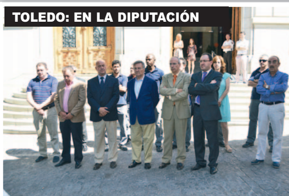
TOLEDO: EN LA DIPUTACIÓN