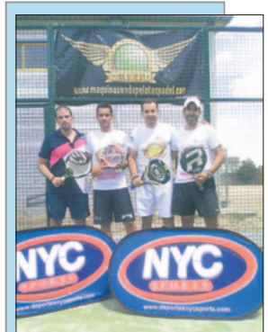
Los cuatro finalistas.