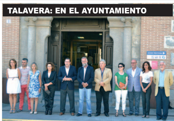
TALAVERA: EN EL AYUNTAMIENTO