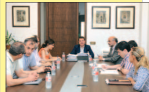
Momento de la Junta de Gobierno. GPAT.