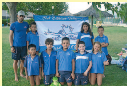
Componentes del CN Talavera desplazados a Madrیدهjos.