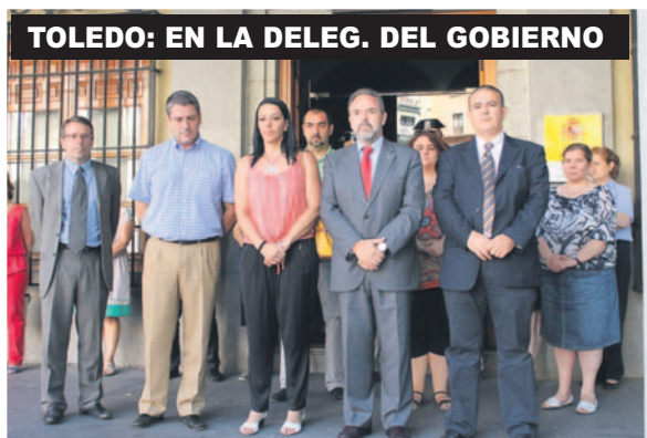
TOLEDO: EN LA DELEG. DEL GOBIERNO