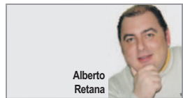
LA CARTA DEL DIRECTOR