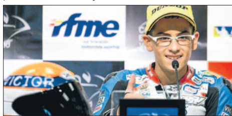
El joven piloto abulense volvió a demostrar su buen calgar en Aragón.