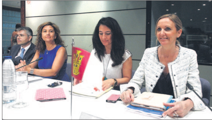
La consejera durante la Conferencia Sectorial de Empleo y Asuntos Laborales, en Madrid.

Sobre este asunto, ha afirmado que "obviamente no todos los que acuden a una Oficina de Empleo y Emprendimiento es para inscribirse como