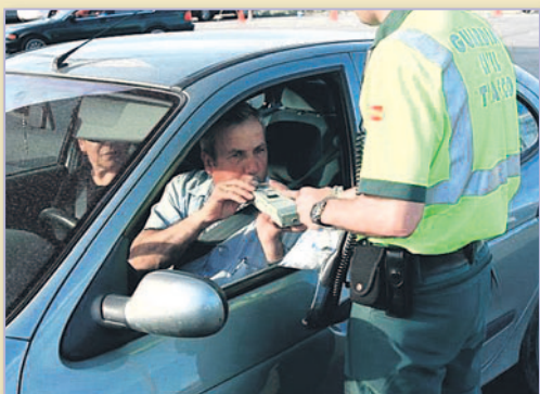
La elección de los conductores se realiza de manera aleatoria.

Los más escépticos: los varones de entre 30 y 39 años -curiosamente, los que mayor índice de mortalidad presentan en accidentes de tráfico causados por el alcohol-, que son quienes se muestran más de acuerdo con la supuesta finalidad económica de los controles.