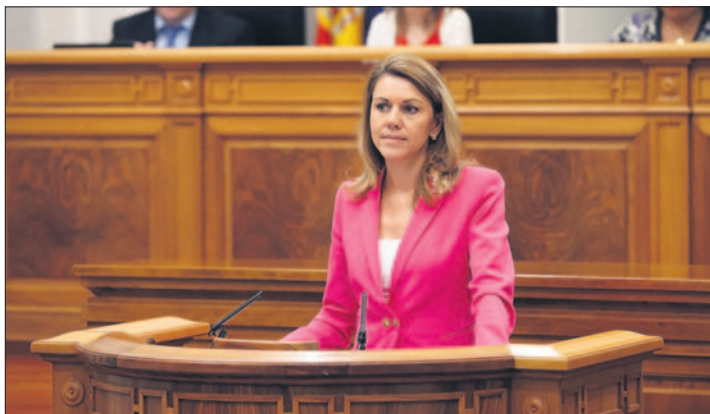
Cospedal durante el pleno y, debajo, los diputados socialistas con los carteles exhibidos.

SIGUIENTE PASO. La reforma del estatuto será defendida ahora por el portavoz del PP en las Cortes de Castilla-La Mancha, Francisco Cañizares, en las Cortes Generales, una reforma que para Cospedal es "generosa y altruista", añadiendo que cuenta con el apoyo mayoritario de la ciudadanía. La presi-