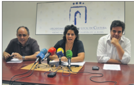
Plataforma e IU pretenden que el memorandum de Levante no prospere. J.F.

Para la plataforma esta intención es "un auténtico golpe de Estado en la planificación española y europea", con los consecuentes perjuicios que este hecho acarrearía para el sector agrícola y ganadero de la cuenca del Tajo. Antes de concluir, Sánchez habló de la memoria del Plan de Cuenca del Segura y lo rechazó por incluir detalles como que el trasvase es "esencial" para el abastecimiento del sureste español y su regadío. Así, la plataforma defiende que un caudal mínimo de 20 metros cúbicos al paso del Tajo por Talavera "sí blindaría el río", y no los 10 que se han aprobado.