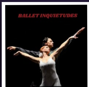
BALLET "INQUIETUDES" (Espectáculo musical)