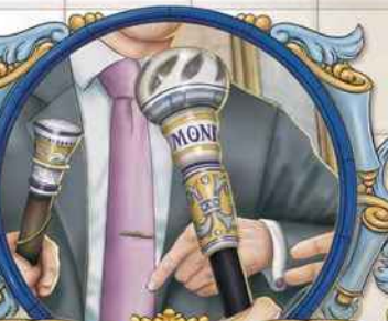
INTERCAMBIO DE BASTONES

principal, los maceros abren la puerta y el Alcalde coloca la bandera y comienza el ngo de la historia de las Mondas, recorren las calles para recordarnos el porqué, y güedad de nuestra fiesta.