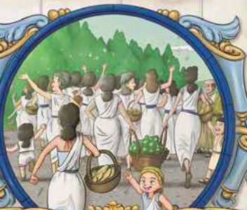
MUJERES DE BLANCO