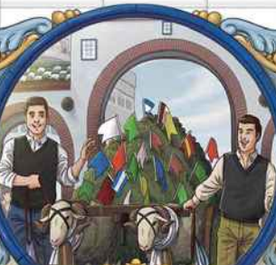
CARRITO Y OFRENDA FLORAL